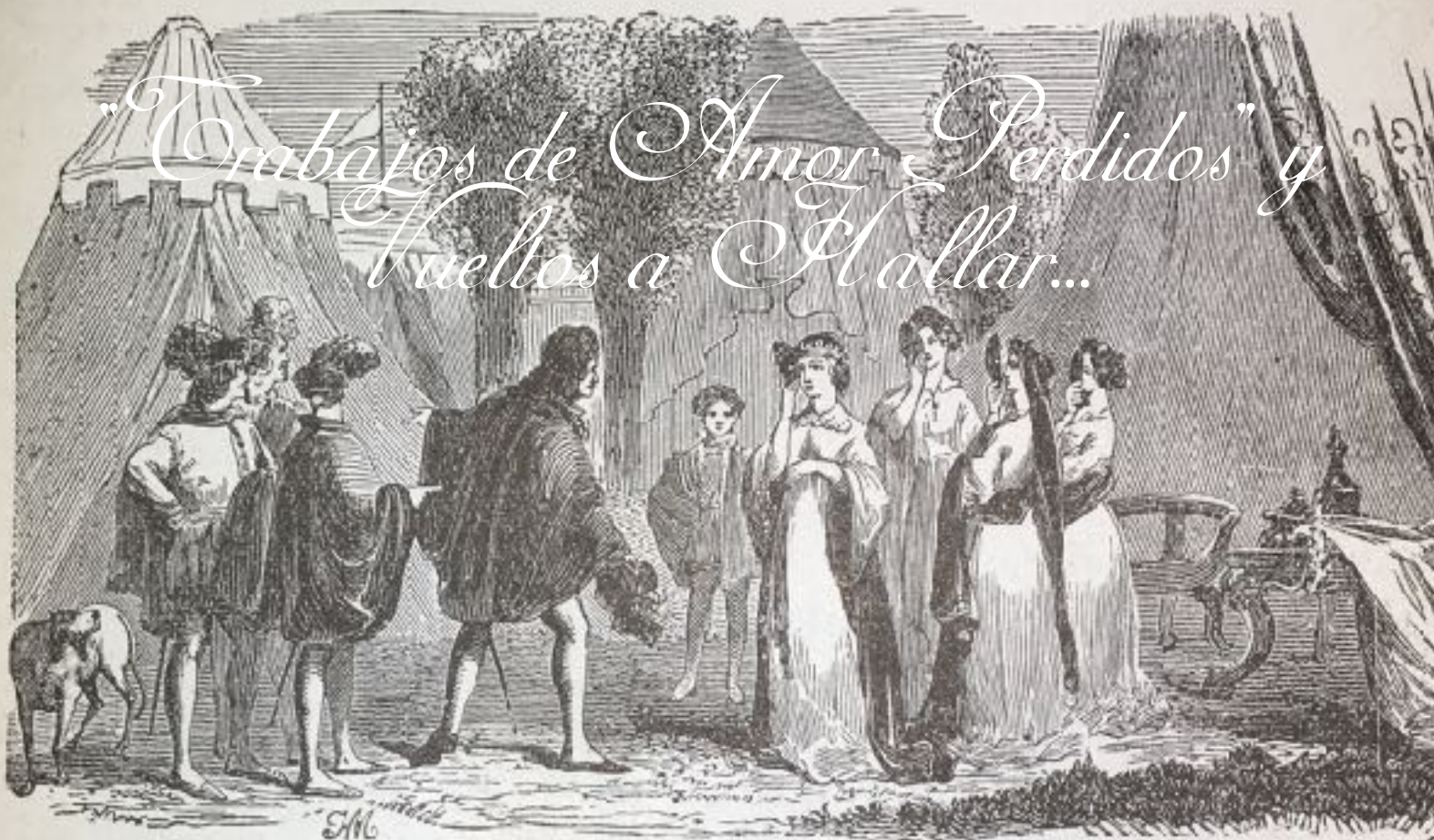
ACT III.—Scene I.