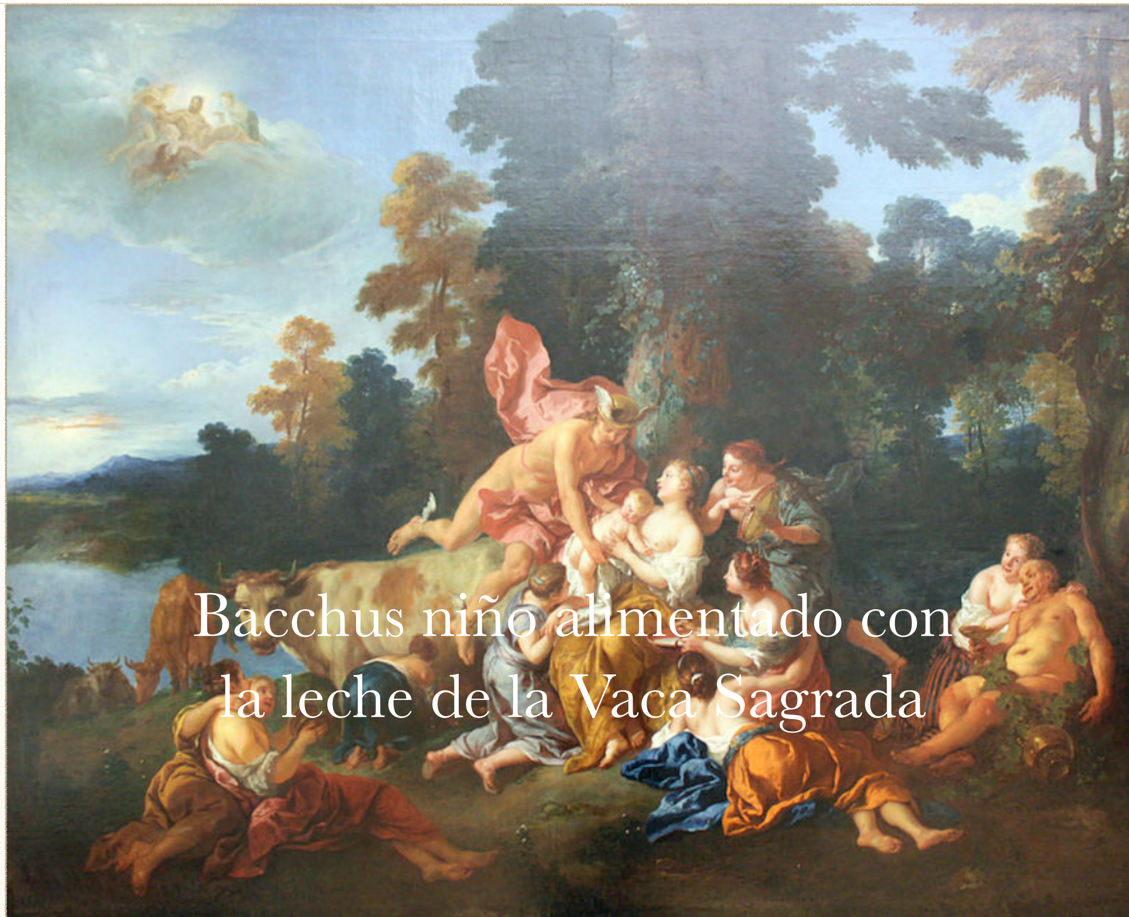
Bacchus niño alimentado con la leche de la Vaca Sagrada