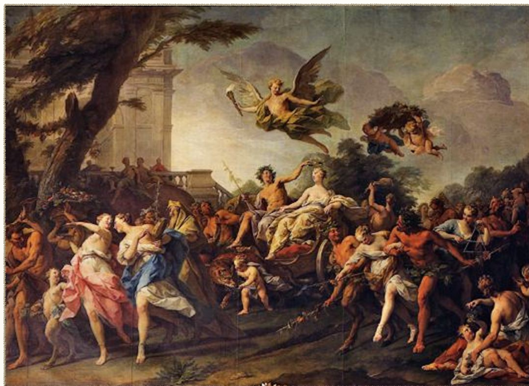
- El Triunfo de Bacchus y Ariadne -