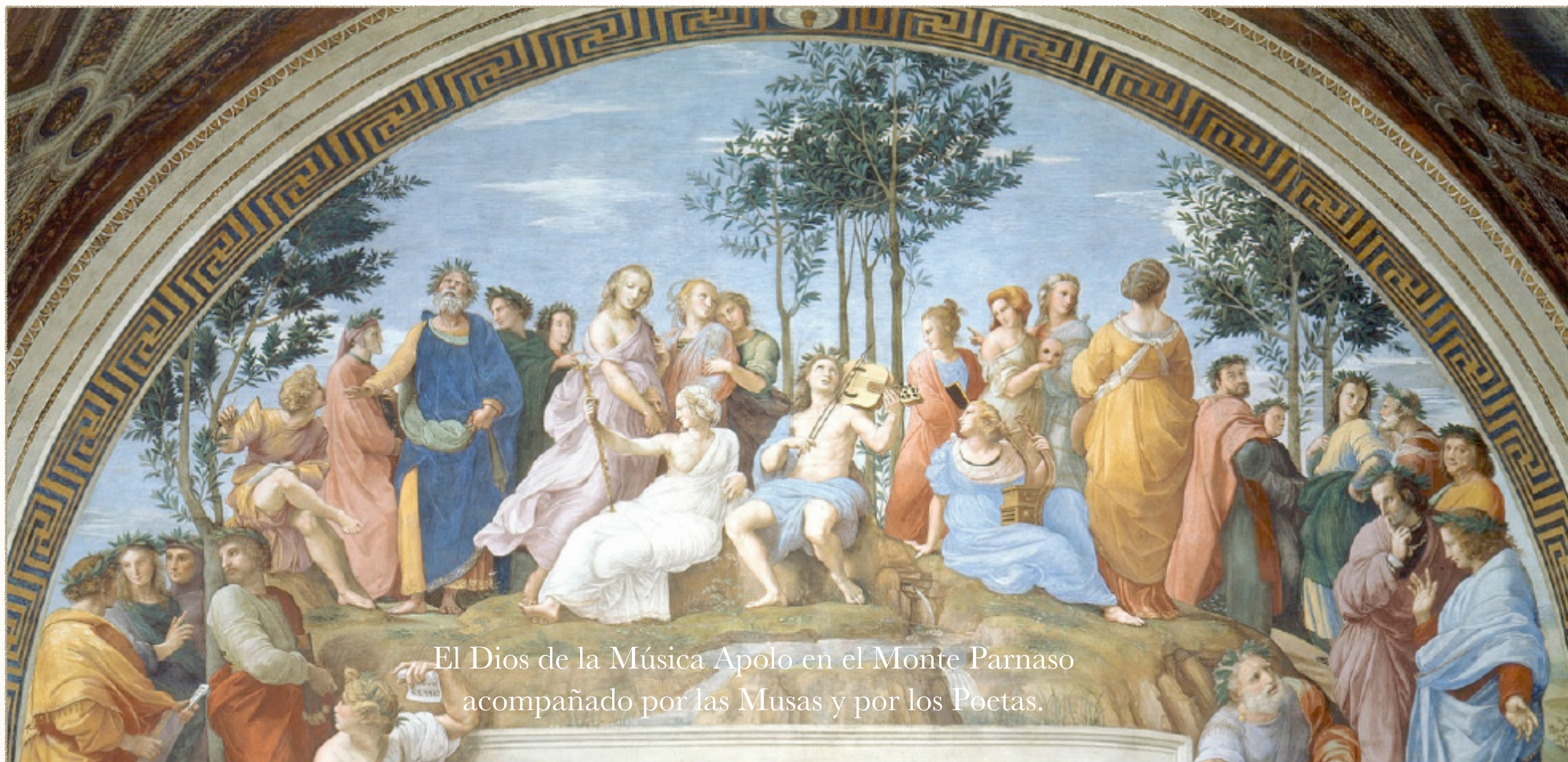
El Dios de la Música Apolo en el Monte Parnaso acompañado por las Musas y por los Poetas.

- Estudios terminados de realizar con la Ayuda de Dios en la Víspera del Shabbath del Viernes 4 de Julio 2014 - Amamos a todos los Seres, a toda la Humanidad. Cada Ser Humano es también la Humanidad.