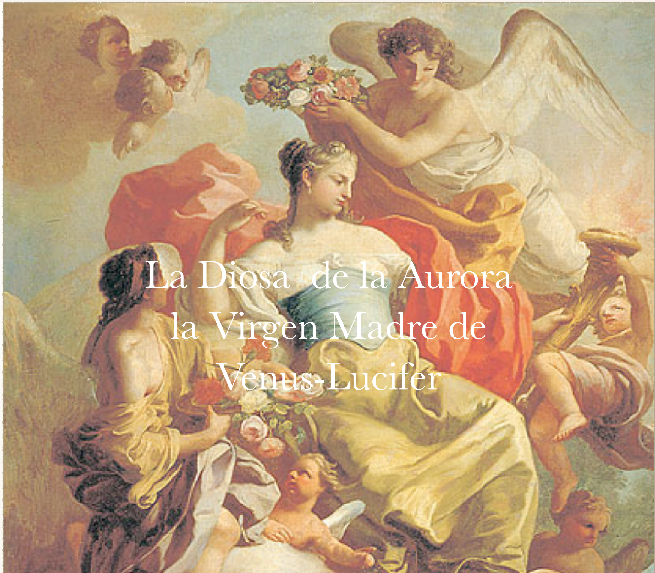
La Diosa de la Aurora la Virgen Madre de Venus-Lucifer